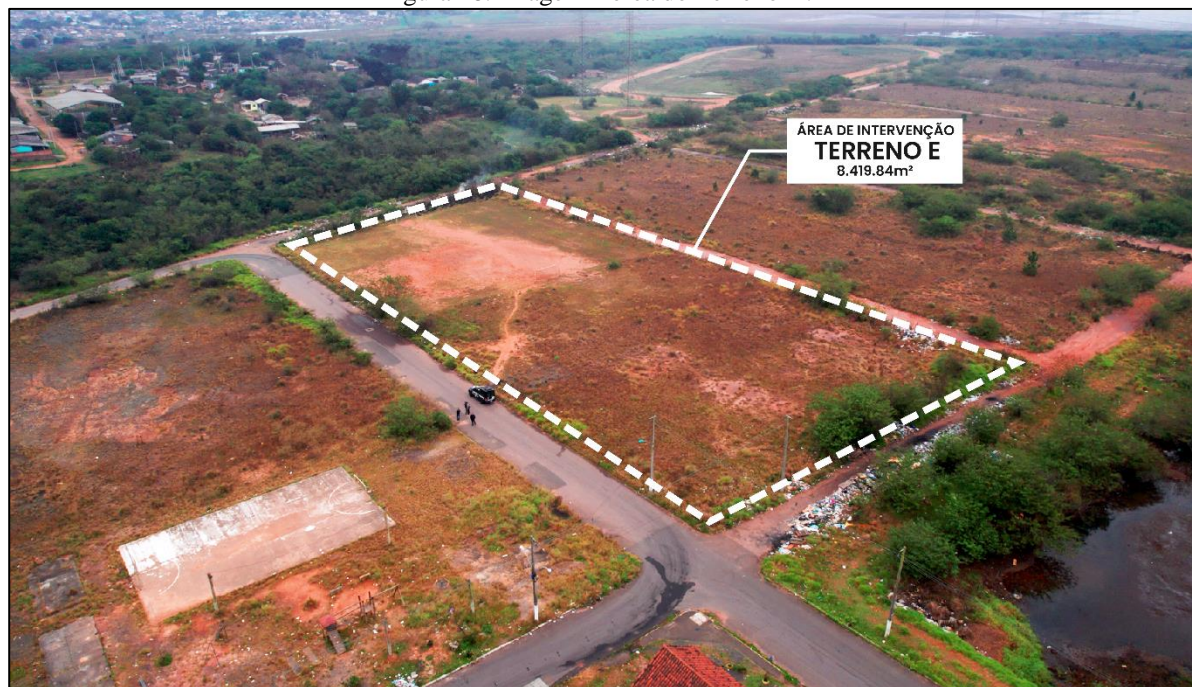
Figura 18. Imagem Aérea do Terreno D.