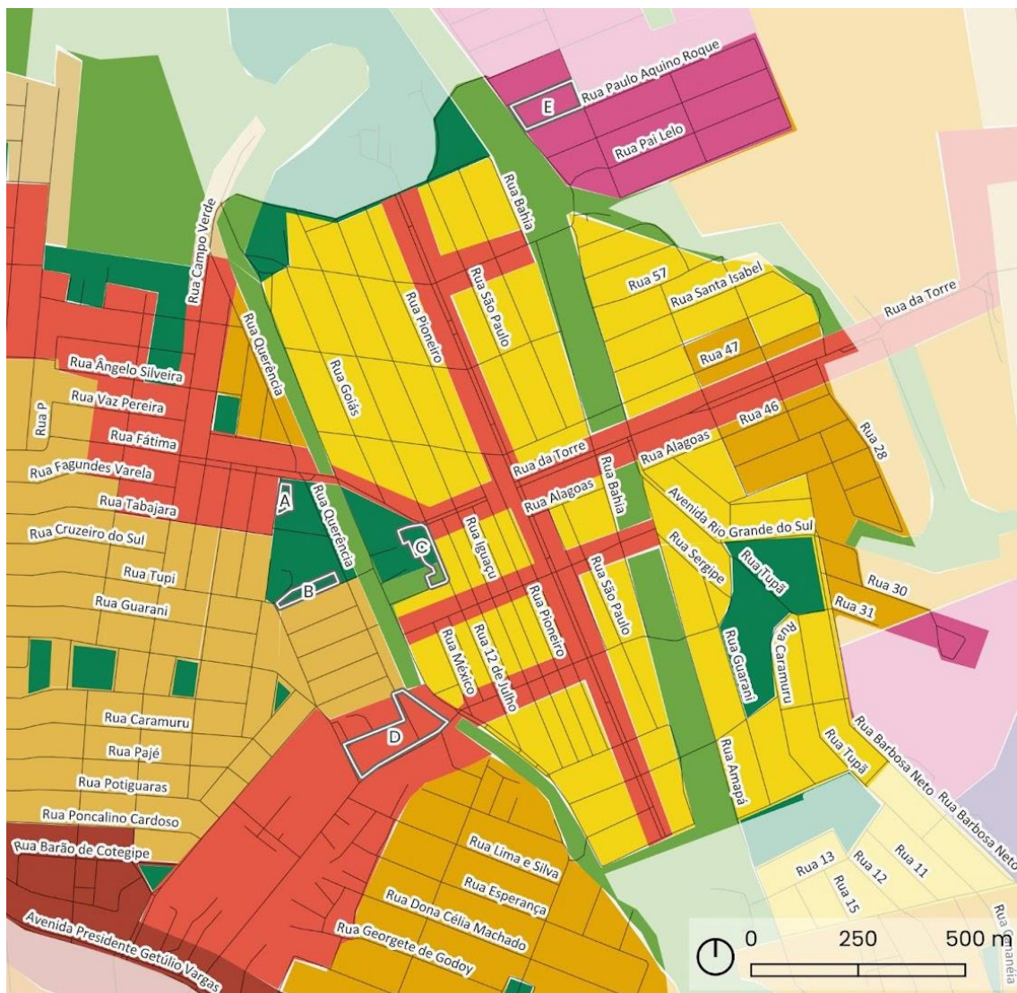
Figura 20: Mapa Técnico Temático: Zoneamento do Plano Diretor.