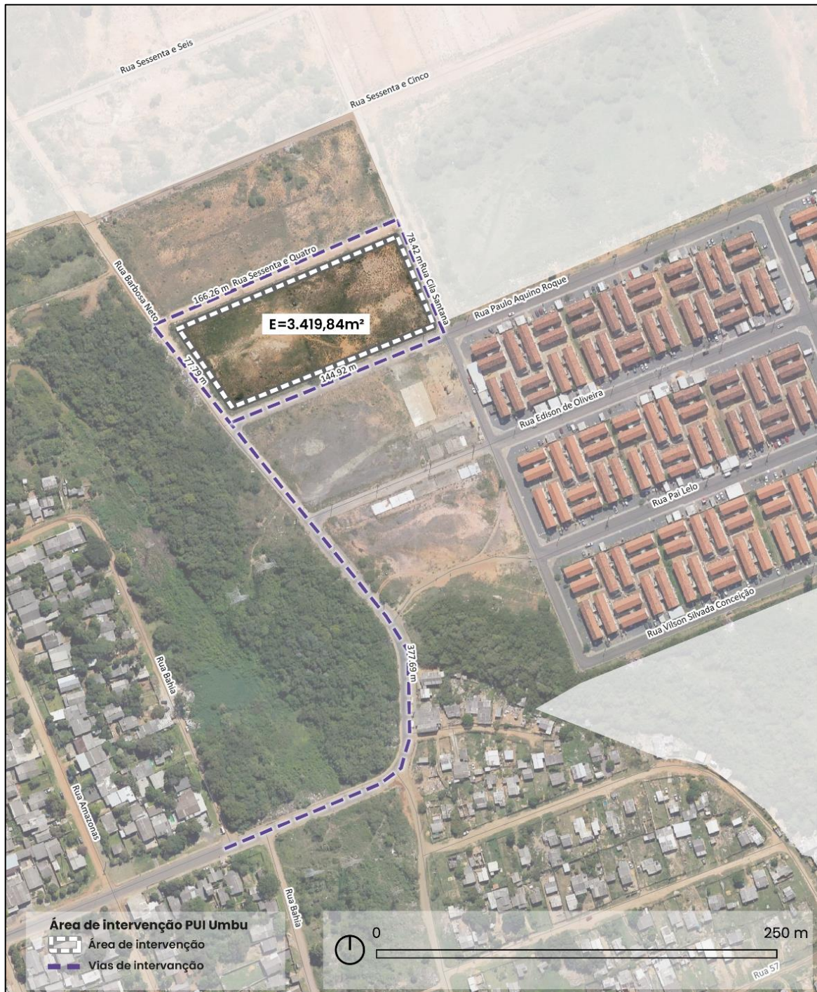
Figura 4. Área de Intervenção E (Umbu, Alvorada, RS).