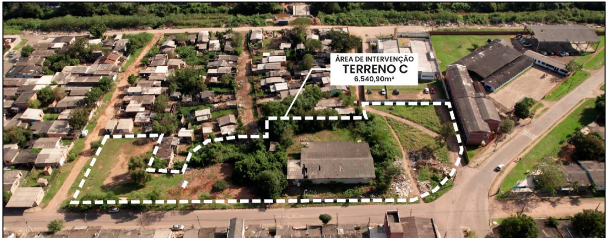
Figura 13. Imagem Aérea do Terreno C.