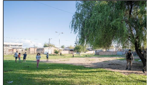
Figura 15. Acesso aos lotes residenciais no Terreno C.