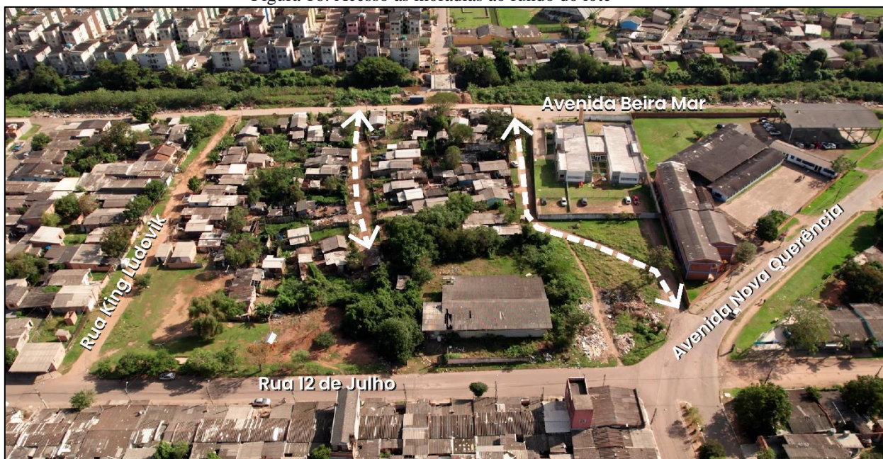
Figura 16: Acesso às moradias ao fundo do lote