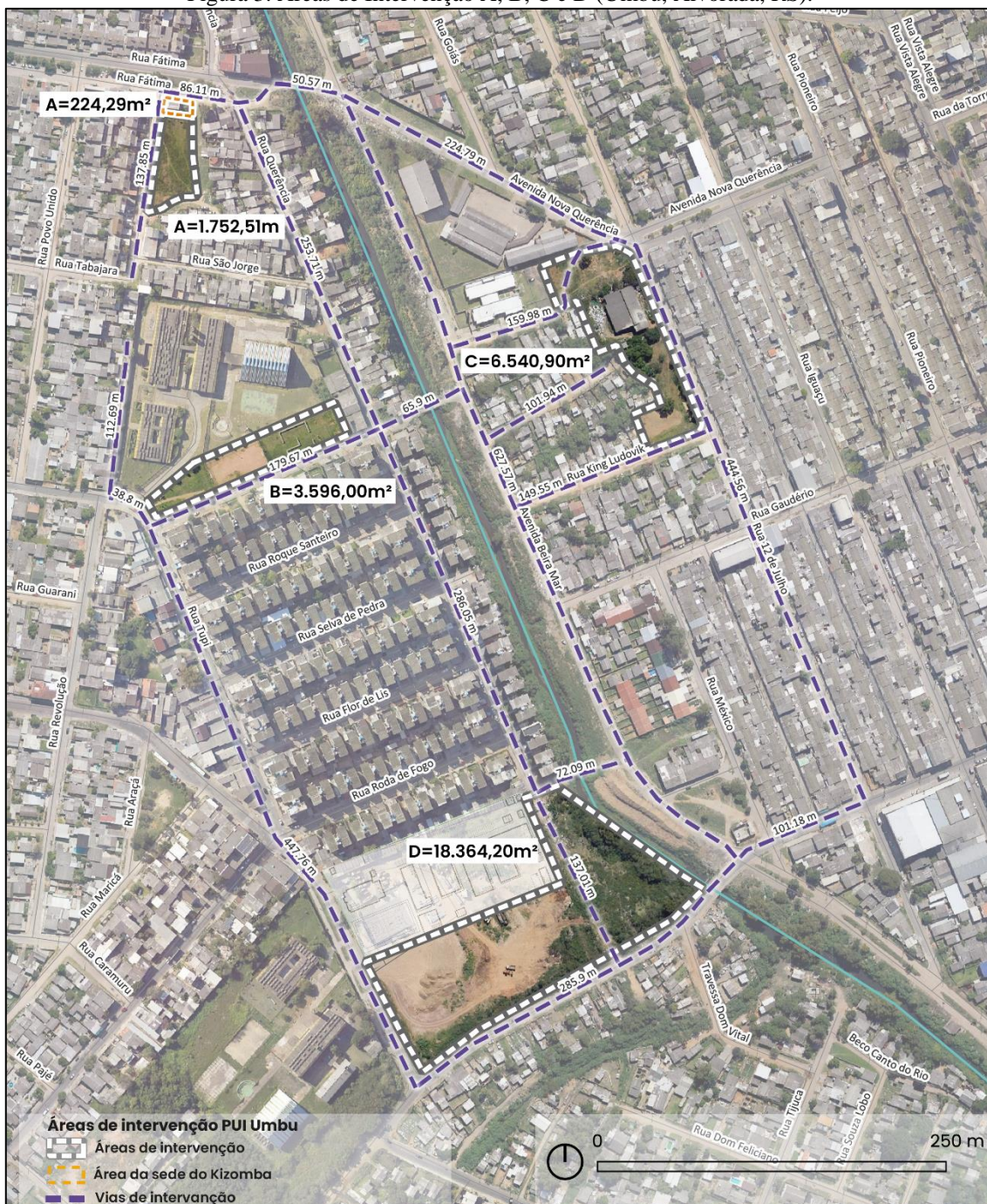
Figura 3. Áreas de Intervenção A, B, C e D (Umbu, Alvorada, RS).