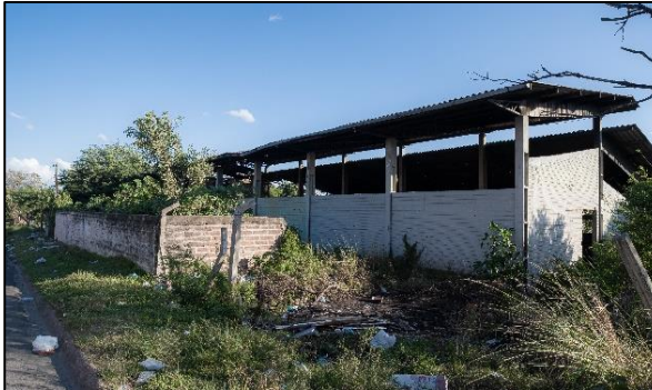
Figura 14. Situação atual da antiga sede da ACATA.