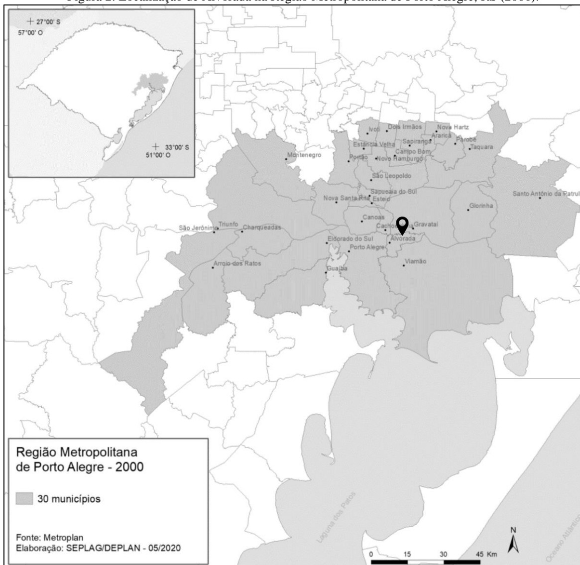
Figura 2. Localização de Alvorada na Região Metropolitana de Porto Alegre, RS (2000).