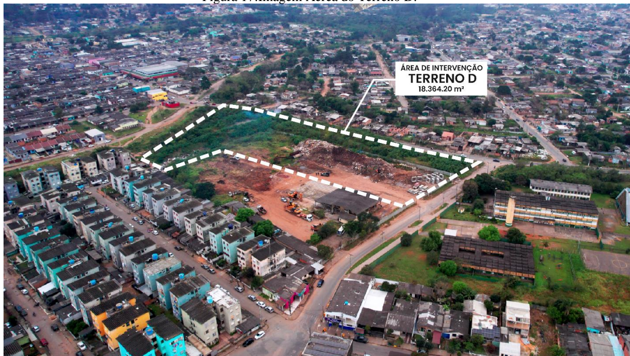
Figura 17: Imagem Aérea do Terreno D.

Fonte: elaborado por Francieli F. Schallenberger. Foto: REN Studios.