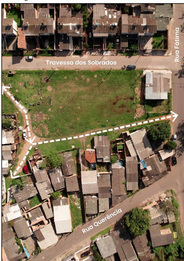
Figura 9. Acesso Local às moradias no Terreno A.

Em relação às vias, para além das diretrizes e programas voltados para todas as ruas listadas no item deste documento (7. Intervenções nas vias), neste lote consta uma especificidade. Trata-se de acessos às moradias locais (Figura 9), que deverão ser respeitados e mantidos, ou seja, as propostas devem incluir vias compartilhadas para garantir o acesso local dos moradores.