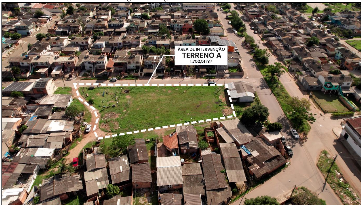
Figura 5. Imagem aérea do Terreno A.

Fonte: elaborado por Francieli F. Schallenger. Foto: REN Studios.