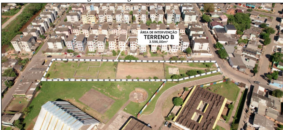
Figura 10. Imagem Aérea do Terreno B.